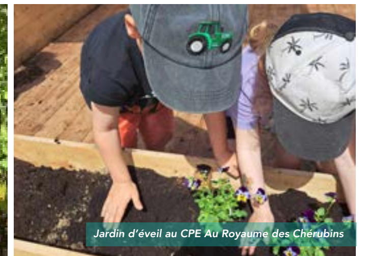
Jardin d'éveil au CPE Au Royaume des Chérubins

Depuis 2014, le programme d'accompagnement et de certification CPE durable s'adresse à l'ensemble des milieux de la petite enfance, soit les centres de la petite enfance (CPE), les bureaux coordonnateurs (BC), les garderies et les milieux de garde du Québec. Il a pour but de soutenir et de faciliter l'implantation de l'éducation relative à l'environnement et des pratiques de gestion durable dans les différents milieux de la petite enfance.