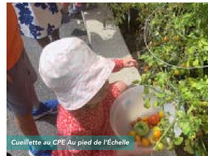
Cueillette au CPE Au pied de l'Échelle

grand projet de mise à jour du programme entamé