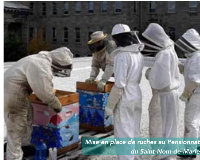
Mise en place de ruches au Pensionnat du Saint-Nom-de-Marie

Depuis 2020, le programme d'accompagnement et de certification Matière verte s'adresse aux écoles primaires et secondaires du Québec, tant publiques que privées. Il s'agit d'un parcours d'accompagnement adapté au milieu scolaire avec la possibilité d'obtenir une reconnaissance via un processus de certification.