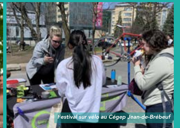
Festival sur vélo au Cégep Jean-de-Brébeuf

Depuis 2004, le programme d'accompagnement et de certification Cégep Vert du Québec s'adresse aux cégeps et collèges du Québec, qu'ils soient publics ou privés. Il a comme objectif d'accompagner les communautés collégiales dans l'intégration de l'éducation relative à l'environnement dans leurs établissements afin de contribuer à la formation d'une jeunesse écocitoyenne.