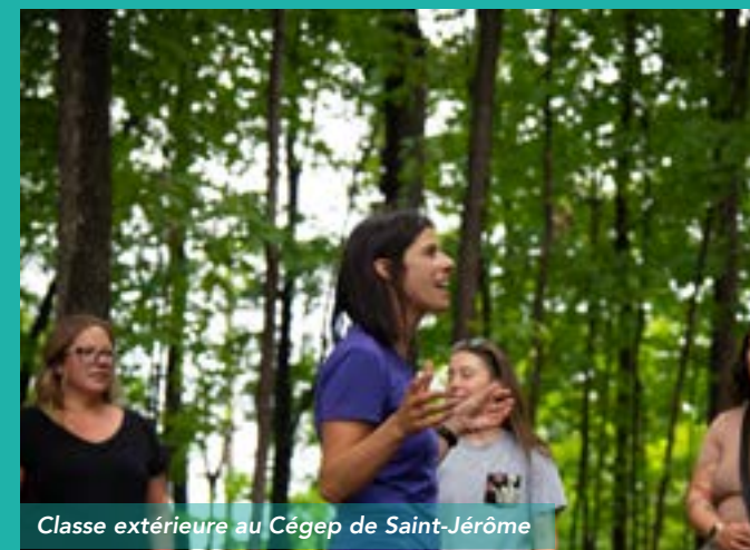
Classe extérieure au Cégep de Saint-Jérôme