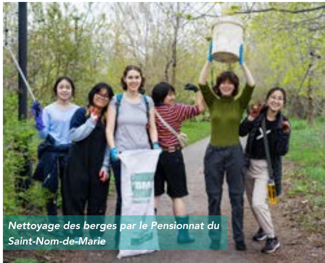
Nettoyage des berges par le Pensionnat du Saint-Nom-de-Marie

24 écoles secondaires, 10 écoles primaires, 2 écoles primaires et secondaires